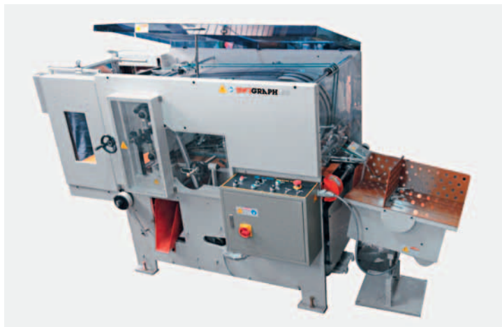
Stanzautomat Swigraph PZ-420, für hohe Stanzgenauigkeit bei sehr guter Laufgeschwindigkeit.

Der neue Spot-UV-Lackierer MK3-F wurde auf der »Dscope 2015« in Dublin (Irland) erfolgreich vorgestellt. Dieser UV-Veredler verfügt über ein innovatives UV-Lack-Applikationssystem, das die partielle UV-Lackierung von Medien mit großer