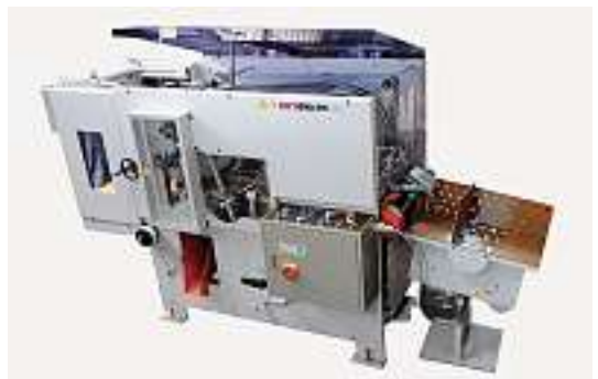
Neu: Stanzautomat Swigraph PZ-420, für hohe Stanzgenauigkeit bei sehr guter Laufgeschwindigkeit.