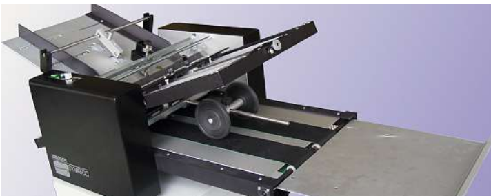
Die Falzmaschine FMZ100 wird auf der Druck+Form live demonstriert.